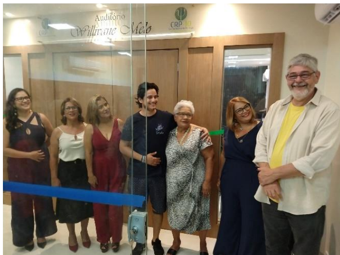
Inauguração do Auditório Willivane Melo na sede do CRP10.