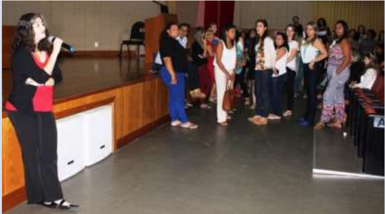
Oficina Nacional de riscos e desastres: Vila Velha