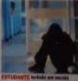
ESTUDANTE humilhado na escola