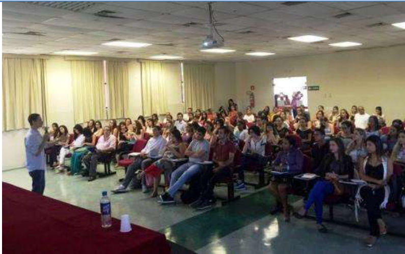
9º CNP / 4º Corep é realizado