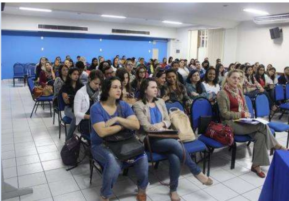
Categoria analisa proposta orçamentária do CRP-16 para 2017