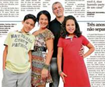
Três anos de distância não separaram casal

Um grande segredo para ter um casamento duradouro é o diálogo. É preciso conversar muito antes de casar, porque se não fizermos isso, o casamento é apenas um contrato legalizado. Não se trata de um contrato, mas de um pacto.