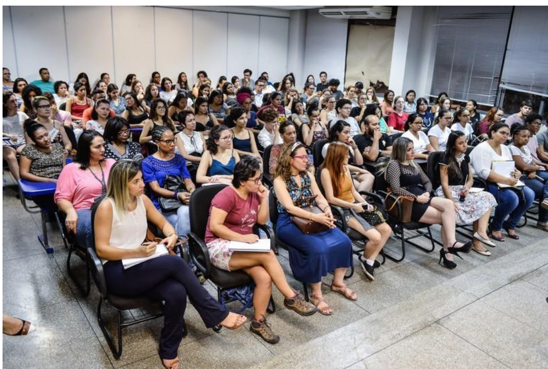
Figura 4 – Encontro Temático da Comissão de Direitos Humanos - Laicidade e Religiosidade na Atuação da Psicologia

O CRP-18 possui em sua estrutura como instâncias que atuam em aspectos específicos, as denominadas comissões ou grupos de trabalho. As comissões se diferenciam em Comissões Permanentes e Comissões Temáticas.