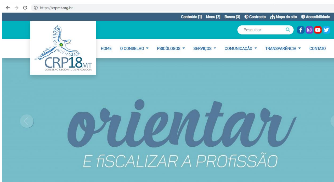
Figura 7 – Site atual do Conselho Regional de Psicologia 18ª Região

No ano de 2018, reestruturamos o site do CRP18, para que permitisse uma maior interatividade, tornando a navegação mais amigável e facilitada, visando principalmente a adequação acessível a portadores de necessidades especiais.