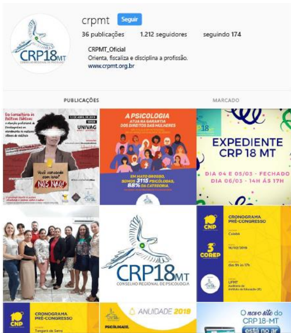
Figura 10