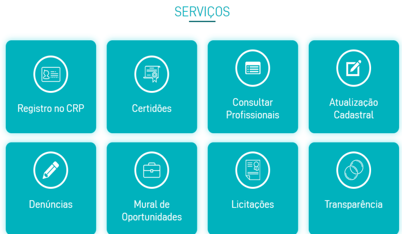
Figura 9 – Site do CRP18

Na versão atual, o site do conselho permite que o profissional realize a impressão de certidões de regularidade profissional, consulta dos profissionais inscritos, unifica a agenda de eventos de todas as Comissões, setores administrativos e Plenário, inclui a informação referente ao acompanhamento dos editais de concursos públicos oferecidos ao psicólogo e reproduz as notícias do CRP na imprensa. Possibilita a realização de inscrições nos eventos e impressão dos certificados de participação.