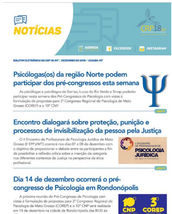
Figura 12 – Boletim Eletrônico CRP18

A ferramenta atende à Lei nº 12.527/2011, denominada Lei de Acesso à Informação (LAI), regulamentada pelo Decreto nº 7724/2012, que normatiza os artigos 5º e 37 da Constituição Federal ao estabelecer que todas as informações disponíveis em qualquer entidade pública sejam disponibilizadas na internet, com exceção apenas de documentos oficialmente declarados como sigilosos.