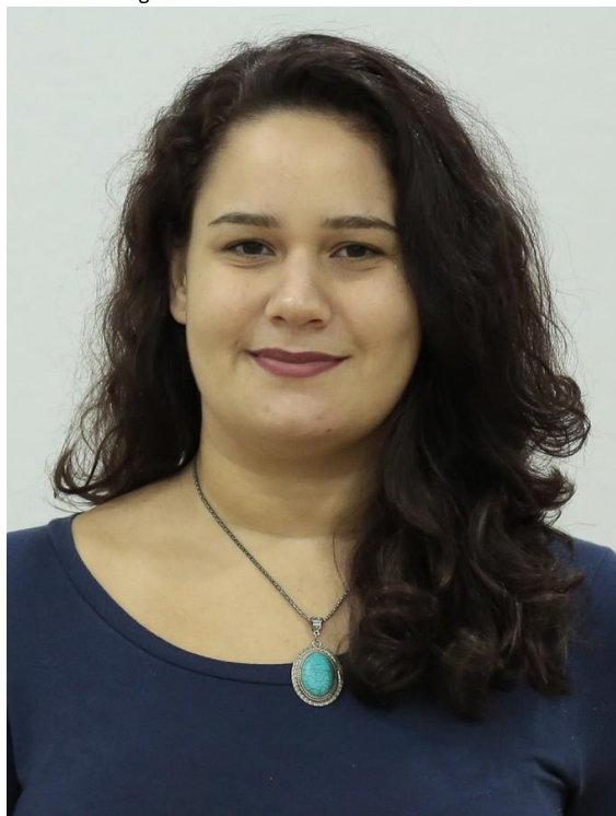
Figura 1 – Foto da Presidente do CRP18

Fechamos mais um ano de gestão do Conselho Regional de Psicologia da 18ª região, atingindo objetivos propostos e avaliando as estratégias utilizadas visando a melhoria no processo de orientação e fiscalização da categoria profissional.