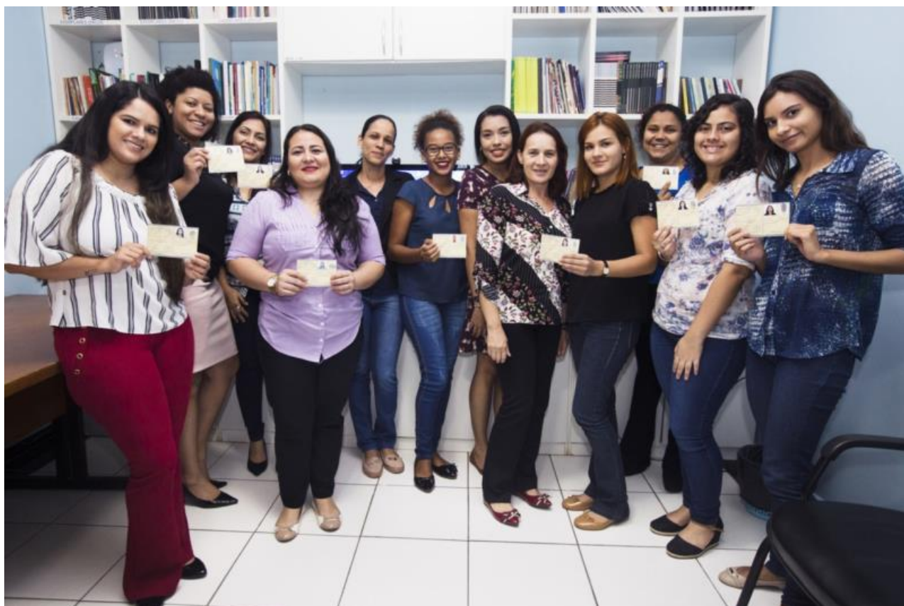
Figura 14 – Entrega de Carteiras de Identidade Profissional - Outubro 2018