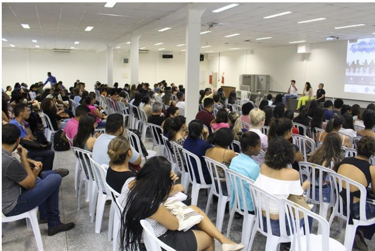
Figura 15 – Evento – “Psicoterapia é só para Psicólogo?” – abril 2018